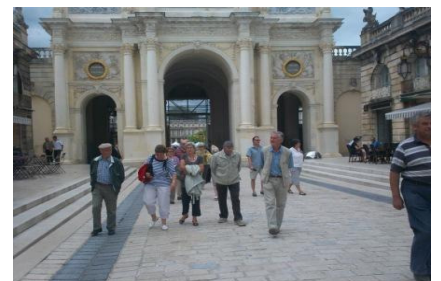
En arrière plan de quelques uns d'entre nous, une des superbes « portes » de la place Stanislas.

Avant de parcourir la ville, nous avons visité une chocolaterie. Nous sommes régalez des dégustations proposées : macarons, marquise de bergamote, spécialité régionale créée à partir de l'essence de cet agrume, et autres mises en bouches diverses au chocolat. Avec, en prime, des conseils de fabrication. Et nous avons quitté l'établissement avec, en cadeau, une boîte de macarons !