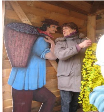
Que va-t-on imaginer ?

Et merci à l'entreprise Dechaud pour le prêt de son matériel ;